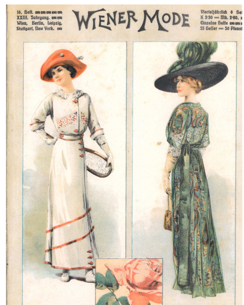
Bild rechts: Einige sehr attraktive Titelblätter von Wiener Modezeitschriften, wobei ich erwähnen möchte, dass sich die Mode vor und nach der Jahrhundertwende 1880/1900 nicht so rasch veränderte wie heute. Faszination auf die modebewusste Damen wie Herrenwelt strahlte sie aber allemal aus.