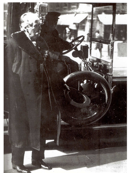
"Habe doch des Guten etwas zu viel getan," sagte Criquolini. "Der Burgunder war vom Teufel gekeltert." (Seite 6.)